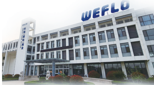
青岛伟隆阀门股份有限公司

上周,海尔智家、青岛啤酒、青岛港位列青岛上市公司热度榜前三位。青岛境内58家上市公司中,超过6成实现股价上涨,伟隆股份、云路股份、天能重工、特锐德、高测股份领涨,上市青企市值再增94亿元。日前,2022年第二批拟转入新三板创新层的挂牌公司初筛名单公布,青岛文达通、青岛鑫光正钢、山东亚微软件、山东瑞朗医药、青岛培诺教育等5家青岛企业入围,青岛上市军团的后备队伍进一步壮大。