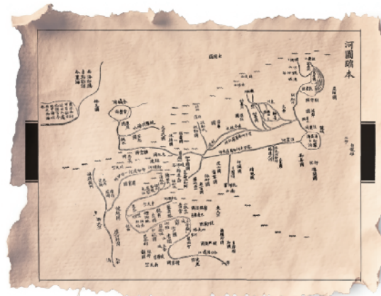
清人绘《水经注图》书影