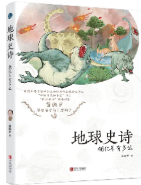
《地球史诗:46亿年有多远》苗德岁 著

多部青版好书入选“中国好书”年榜、月榜,大家一起来品阅一下此次精选出的青版图书吧!