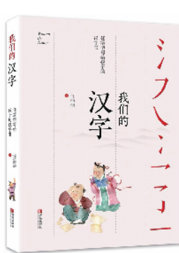
《我们的汉字:任溶溶写给孩子的汉字书》任溶溶 著

本书是以海洋科考为主题的儿童文学作品,通过一封封温润的家书和特别来信,聚合成中国海洋战略独特的时代画像。从极地科考到深海万米探测,作品在较大的时间跨度和空间跨度中,铺展出中国海洋科技的辉煌成就。中国第一艘海洋实习调查船“东方红”号的海上历险,极地破冰船“雪龙”号的南极救援,航天测量船远望号的默默守护,载人潜水器被海底黑烟囱侵袭的惊魂时刻……一个个细节满满的科考故事,将海洋科考大国重器的迭代、中国几代海洋科学家群像、海底冷泉热液等地质与生命奇观,鲜活地展现了出来。